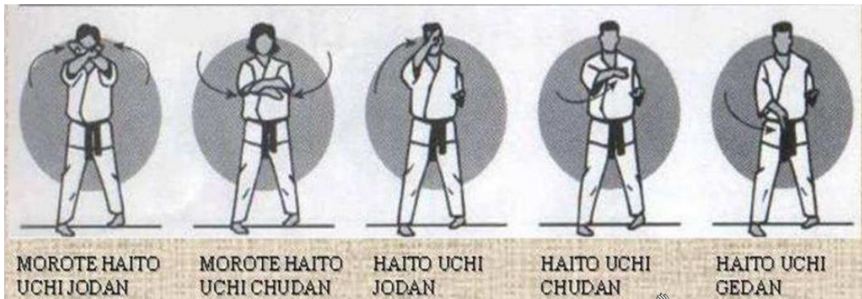
Uke ( blokkeringer)